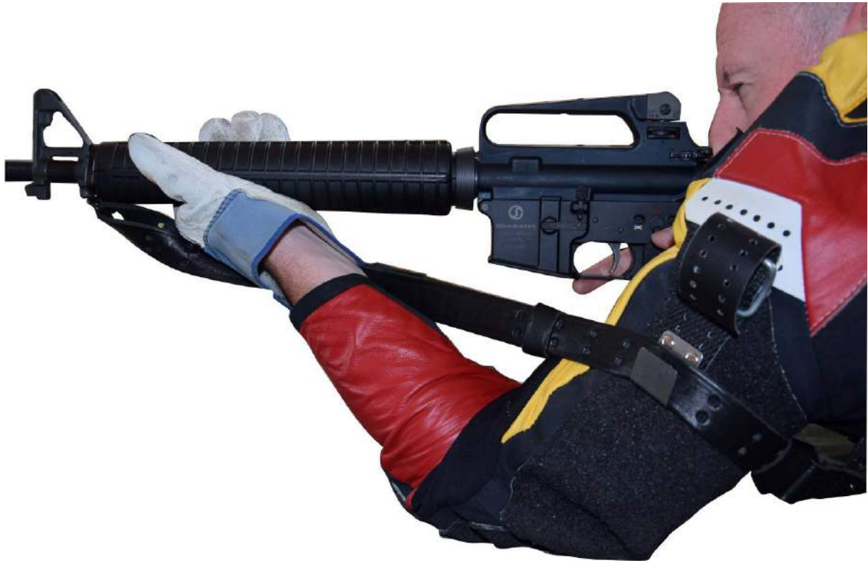
Bretelle attachée au bras via une veste de tir interdite