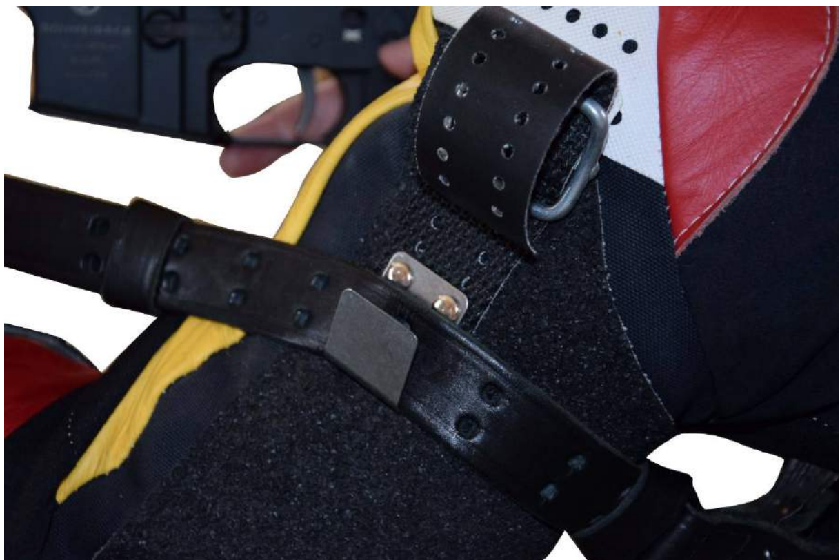
Vue en gros plan du système d'attache au bras interdit