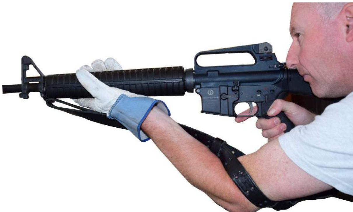
Autorisée bretelle double loop avec gant