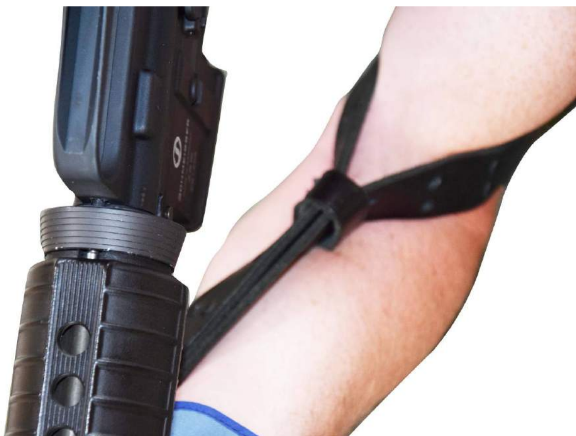
Autorisée – vue du dessus